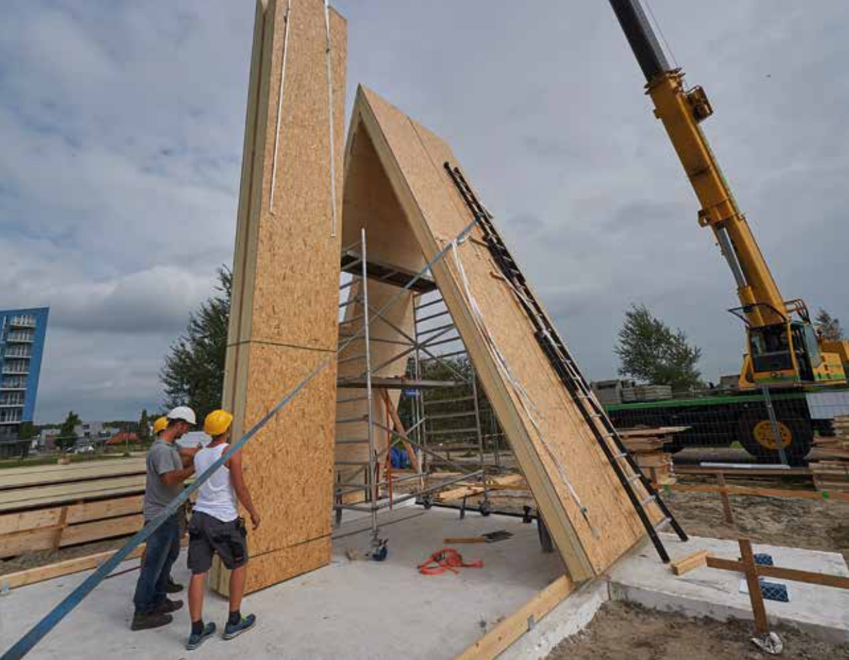
Tiny House 'A' in aanbouw.

dit hiervoor serieus interesse is. In dat wijkje hebben 33 particulieren hun eigen huisje gebouwd op een bouwvlak van 8 bij 8 meter (bvo). In Vinexwijken is het weinig gebruikelijk dat mensen die woonmogelijkheid wordt gegeven. Ondanks dat de groei van de een- en tweepersoonshuishoudens één van de belangrijkste demografische ontwikkelingen in ons land is”.