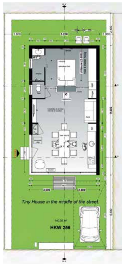
Plattegrond Connies Corner

Ik nam een architect in de arm die precies mijn ideale tiny house ontwierp. Het heeft de maximale afmeting van 50 m 2 woonoppervlak, op de kavel is nog genoeg ruimte voor een tuin, zodat ik toch nog een beetje het weidse gevoel zal hebben van een tiny house in een veld. Mijn huis is gelijkvloers, heeft geen gangen, hallen en tussendeuren.