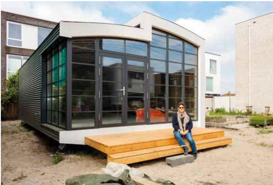
Boven: Niek Bakker Onder: Connies Corner opgeleverd